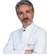
ORTOPEDİ Op.Dr. Özgür Bülent YAZICI Likya Hastanesi