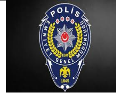
GENEL GÜVENLİK (Emniyet Toplum Destek Birimi)